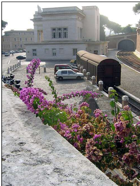
Photographie de Reinhard Dietrich, 2 octobre 2008, « gare ferroviaire du Vatican », Domaine public,

La gare du Vatican a été inaugurée le 3 octobre 1934.