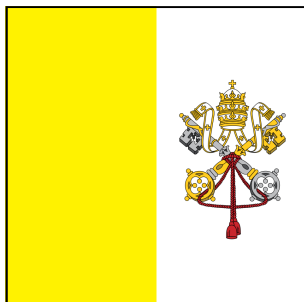
Drapeau de la Cit   du Vatican, version 2023.Domaine Public

Le Vatican est le plus petit   tat ind  pendant du monde.